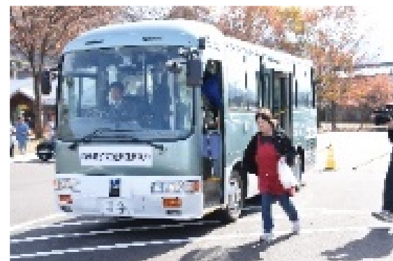
貨客混載からの商品取卸