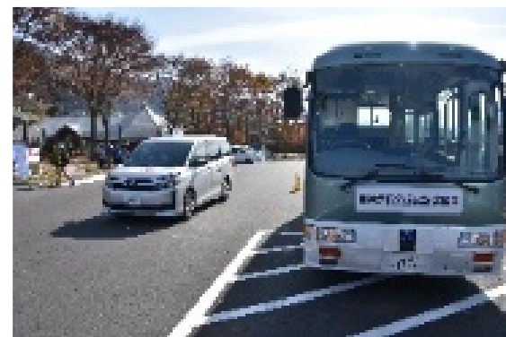
自動運転バス×A I タクシー