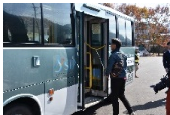
A I タクシーからの乗継